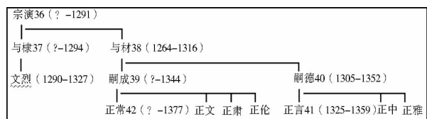
元朝正一道张天师的传承世系图

明初的正一道天师继承制度，直接承元朝而来。在讨论明朝天师继承制度及其转变以前，有必要先明了元朝的天师继承制度。以下是元朝 36 代至 42 代天师的传承世系图：